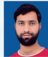
मिर्जा अलीम अहेमद बेग बदनापूर शहराध्यक्ष